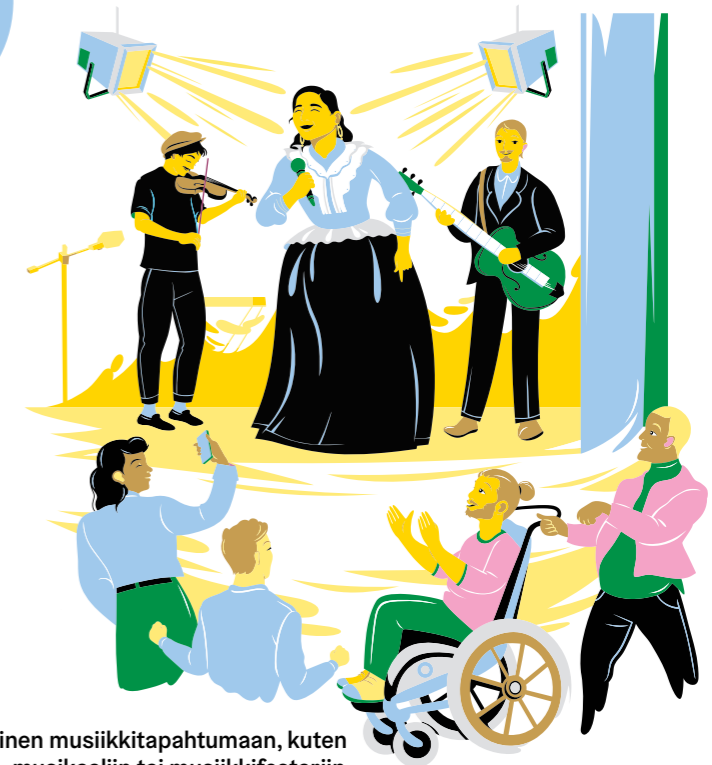
Osallistuminen musiikkitapahtumaan, kuten konserttiin, musikaaliin tai musiikifestariin