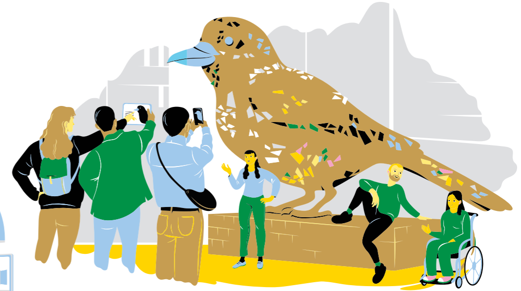
Tutustuminen kaupunkikulttuuriin, kuten julkiseen taiteeseen, puistoihin ja veistoksiin tai osallistuminen kaupunkikävelykerrokseen tai kaupunkifestariin