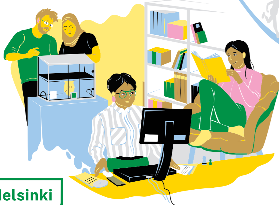
Kirjastovierailu esimerkiksi kirjavinkkauksen, kirjastonkäytön tai tiedonhankinnan opastuksen muodossa