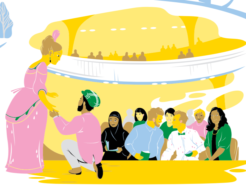
Tutustuminen elokuvaan tai esittävään taiteeseen, kuten performanssiin, sirkukseen, tanssiin tai teatteriin