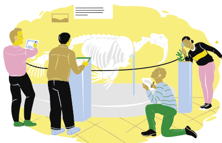
• Besök till ett aktuellt museum eller en aktuell utställning

En bricka fylld med godsaker i form av kulturupplevelser som främjar välbefinnandet! Mångsidigt och fördjupande innehåll för olika läroämnen och utbildningar.