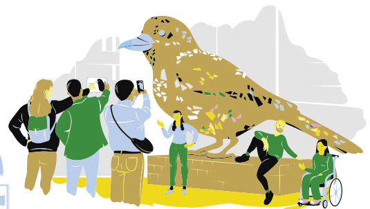
• Bekantande med stadskulturen, såsom offentlig konst, parker och skulpturer, eller deltagande i stadsvandring eller en stadsfestival