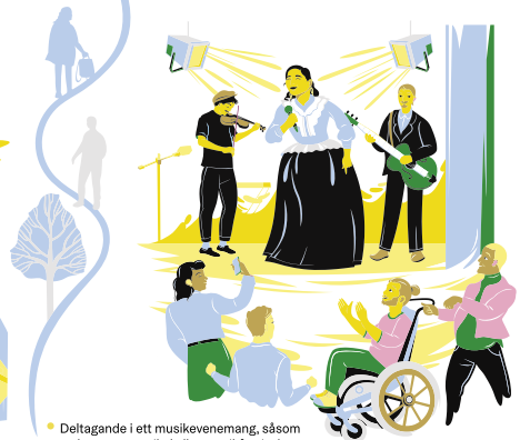
• Deltagande i ett musikevenemang, såsom en konsert, musikal eller musikfestival