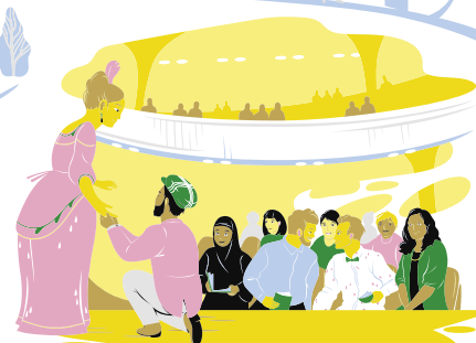
• Bekantande med film eller scenkonst, såsom performance, cirkus, dans eller teater