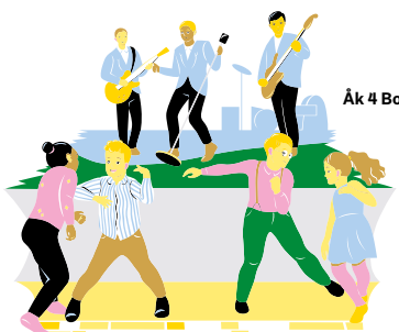
Åk 4 Borgmästarens självständighetsfest