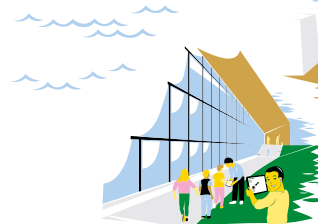
Åk 1 Biblioteksbesök till nårbiblioteket