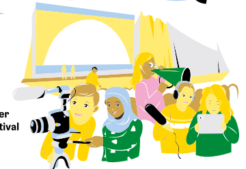
Åk 9 Föreställning för skolelever eller filmfestival / konsert eller musikfestival