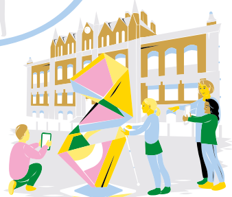
Åk 5 Helsingforsbiennalen / Helsinki Design Week