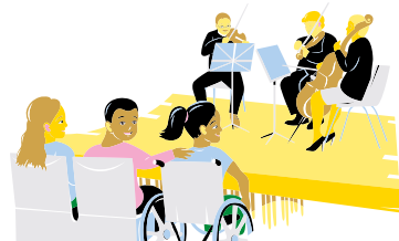
Åk 2 Andraklassares konstupflykt (Helsingfors festspel, Kiasma, Helsingfors stadsorkester och Musikhuset)