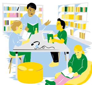
Åk 7 Bokprat