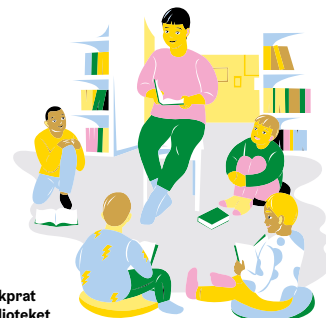
Åk 3 Bokprat i nårbiblioteket