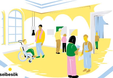
Åk 8 Museibesök